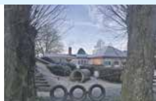
Safe the date!