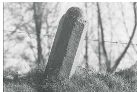
Dijkpalen markeerden de stukken dijk die per aanliggende boerderij onderhouden moesten worden. Er zijn er nog een paar over, zoals deze langs de Sallandse IJsseldijk, 1 kilometer ten zuiden van de zuidelijke kolk van de Harculocentrale.

Een dijk is door mensen aangelegd en geen natuurverschijnsel. Aanleg, verbreding, rechttrekken; de afgelopen eeuwen is onze dijk voortdurend veranderd. De komende jaren wordt de dijk bij Olst verzaagd; nodig vanwege grilliger waterstanden. Dat betekent veranderingen in het landschap. Dergelijke veranderingen zijn van alle tijden. In drie artikelen blikken we terug op de geschiedenis van de dijk in onze gemeente. Deze week aflevering 2: gemeenmaking van de dijken.