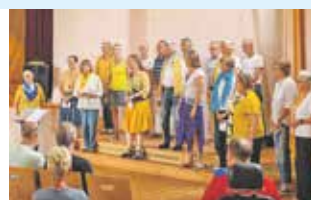
Wereldkoren van start