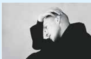
Nwe concertserie Nicolaaskerk