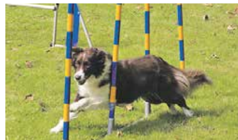
Snel en behendig gaat Flame tussen de paaltjes door.