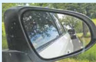
Kun je me volgen? 9