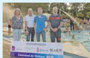
Samenwerking verlengd 4