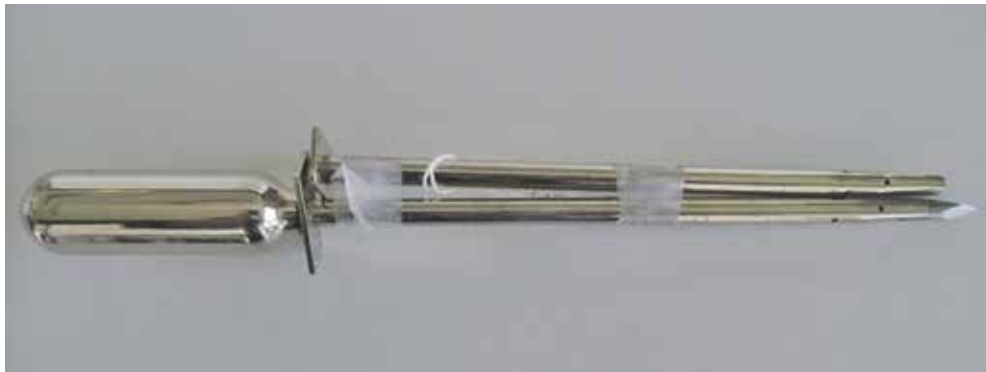
penstrocart instrument veearts