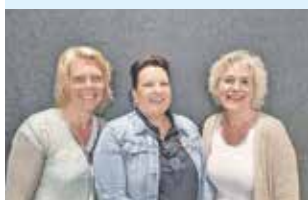
Een fijn thuis, nu en later 3

Huis aan huis in de gemeente Olst-Wijhe, Dorpen Diepenveen, Windesheim, Lierderholthuis en Broekland