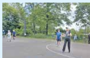
Dynamic Tennis 10