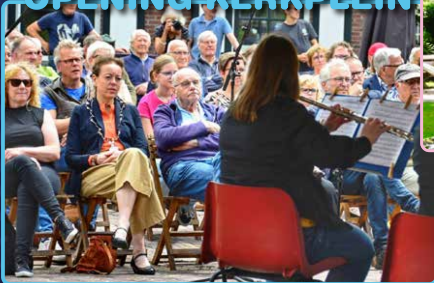
Zaterdag was de officiële opening van het Kerkplein in Olst, met een concert van de Olster Harmonie.