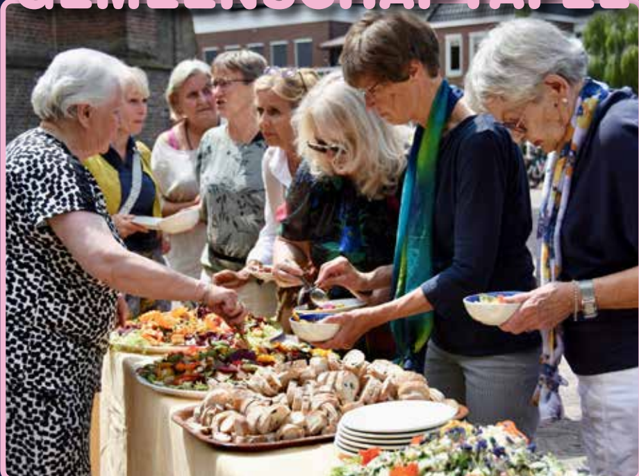
Zondag - Gemeenschaptafel Kerkplein Olst