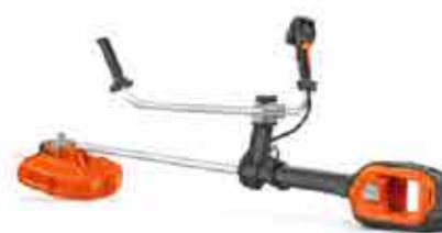
bosmaaiers en grastrimmers