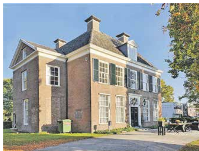
ABC De Cirkel, begeleidt volwassenen met niet aangeboden hersenletsel (NAH), autisme en psychosociale problematiek.

De fotogroep presenteert met trots een boeiende foto-expositie in Huize Westervoorde. De tentoonstelling, samengesteld door de fotografen van ABC De Cirkel, belooft een weergave te zijn van hun talenten en de wereld om hen heen.