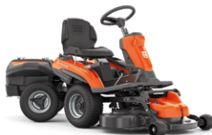
zitmaaier op accu