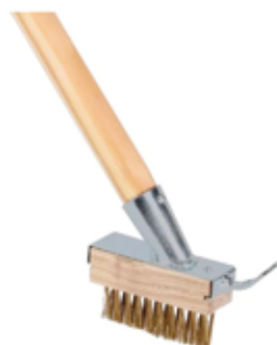
onkruidborstel voor €11.89

Bij ons vind je het hele jaar door acties passend bij het seizoen. Aankomend weekend hebben wij voor jou: