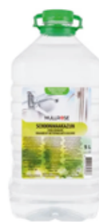
schoonmaakazijn voor €2.99