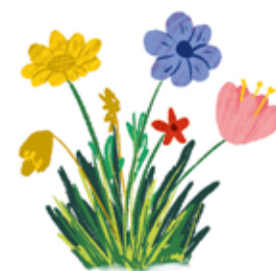
wekelijks nieuwe buiten planten & bloemen