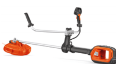
bosmaaier op accu