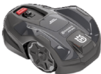
robotmaaier op GPS

In onze winkel vind je een ruim assortiment aan Husqvarna machines. Wij geven je graag advies op maat!