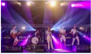
Sweatshirts slotact Salland Live! 3

Huis aan huis in de gemeente Olst-Wijhe, Dorpen Diepenveen, Windesheim, Liederholthuis en Broekland