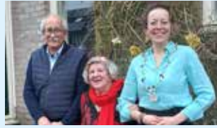
Echtpaar 60 jaar samen 4