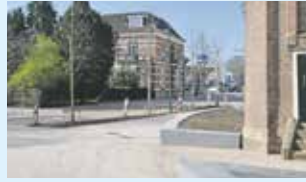
Het groene hart van Olst 12