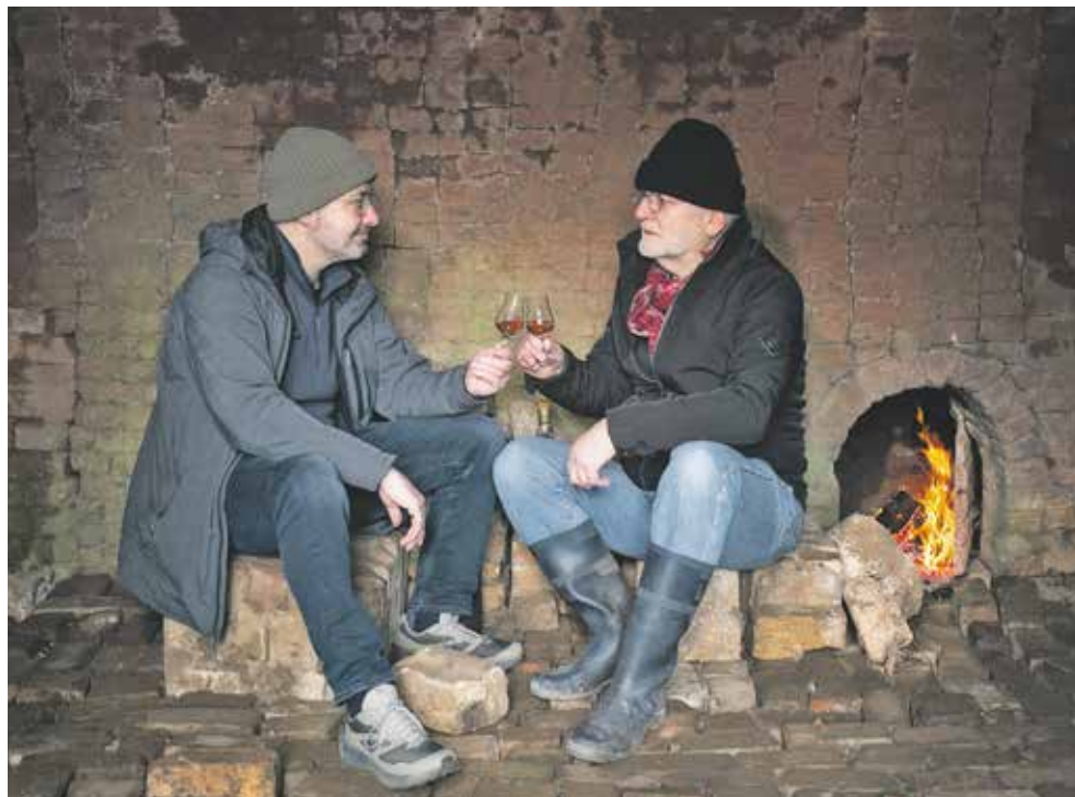
De beide exposanten van 'Skye High'.

Voor genodigden was afgelopen zaterdag de officiële opening van de foto expositie. De middag kreeg een extra Schots tintje door de muziek van een doedelzakspeler en een mini whiskyproeverij. Hiermee liep het Infocentrum vooruit op de whiskyproeverij die zij op donderdagavond 21 maart in de expositieruimte mede-organiseert. Reserveren kan bij slijterij De Dom of bij het Infocentrum.