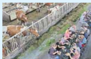
Samen Tafelen in Salland