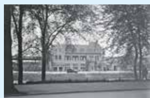
t'Olster Erfgoed presenteert