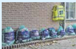
Actie schone rivieren