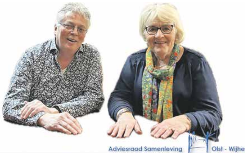
Adviesraad Samenleving Olst - Wijhe

spreken met verschillende adviesraadsleden. Wij gaan met jouw opmerkingen en signalen aan de slag. Het wordt, zonder jou te noemen, verwerkt in ons advies. Jij en wij met alle inwoners uit de gemeente Olst-Wijhe vormen met elkaar de gemeenschap. Denk en praat mee over het beeld dat we samen bepalen voor onze toekomst? De visie moet van de samenleving zijn en daar zetten wij op in. Zien wij je ook? Lees je dit artikel te laat. Je mag altijd contact zoeken via onze website om je signalen te delen of vrijblijvend een bijeenkomst bijwonen. www.adviesraadsamenleving-olstwijhe.nl