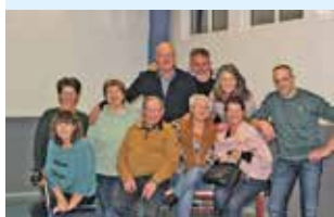
'Bajesbonje' op de Boerhaar 5

Huis aan huis in de gemeente Olst-Wijhe, Dorpen Diepenveen, Windesheim, Lierderholthuis en Broekland