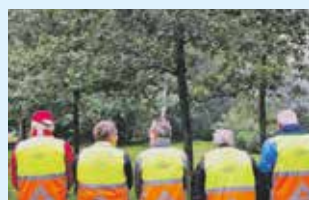
Verkeersregelaars gezocht 9