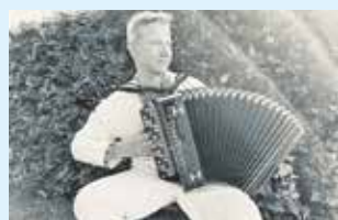
Oekraïne-dag in Wijhe 13