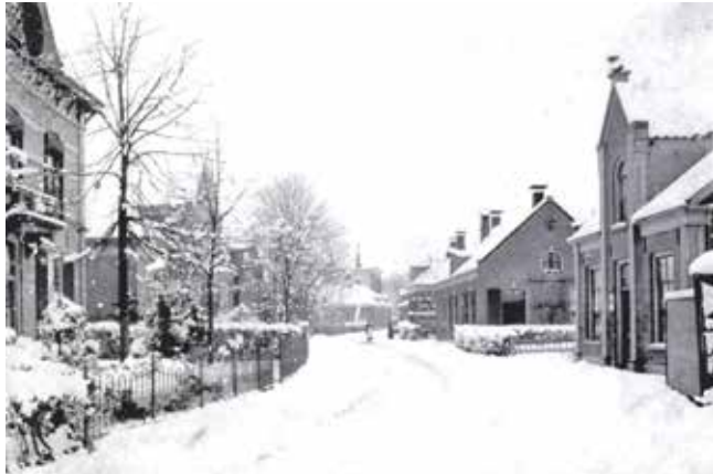
Winter Aaldert Geertsstraat in Olst.

Dit jaar viert de historische vereniging 't Olster Erfgoed het 35 jarig bestaan. Dit gebeurt door de uitgifte van een speciale editie van het eigen magazine, Tijdschrift.