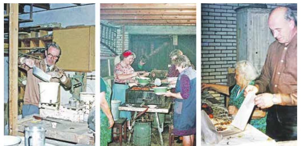
Onderschrift foto: afwegen, bakken en inpakken tijdens oliebolactie Sempre Crescendo in 1976

Rond 10.00 uur gaan de leden het dorp in voor de verkoop van de oliebolle. Naast de huis-aan-huis verkoop zijn de versgebakken oliebolle ook te koop aan de kraam bij Albert Heijn Middeldorp aan de Dorpsstraat en Boomkwekerij & Tuincentrum Gooiker aan de Wechelerweg. Voor de verkoop aan huis kan constant betaald worden of met een QR code via uw bankapp. Bij de kraam kan ook via de pin betaald worden.