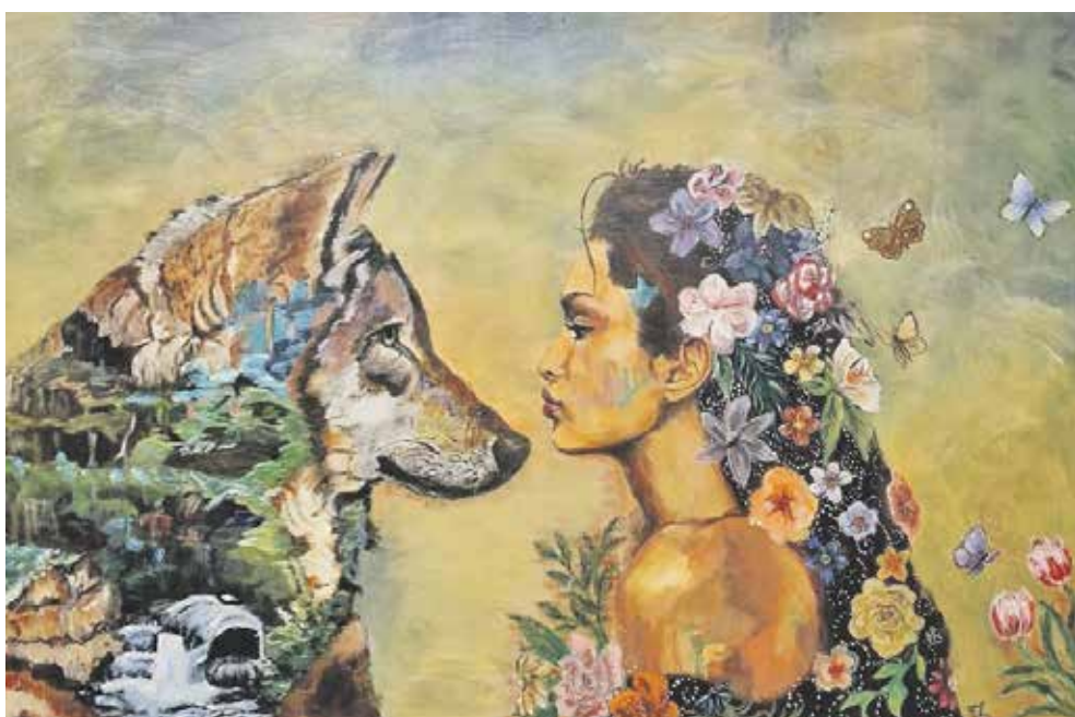
Vriendschap Trees Schutte

op herhaling in de gangen van het Weijtendaal