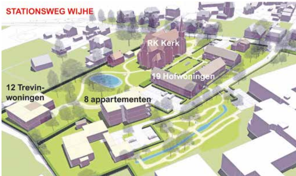
De plannen aan de Stationsweg, die de buurt als rigoreus beschouwt. (Kaartje: Sacon Zwolle)

Bewoners van de Stationsweg zijn bezorgd over de bouwplannen rond de RK-kerk in de 'mooiste straat van Wijhe'. Ze vrezen kaalslag en verstening terwijl de gemeente Olst-Wijhe de plannen juist als een forse vergroening introduceert.