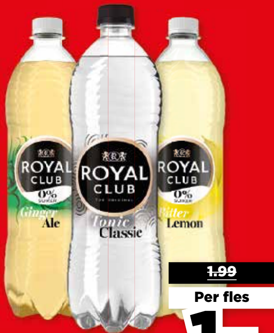
Royal Club Alle flessen à 1 liter