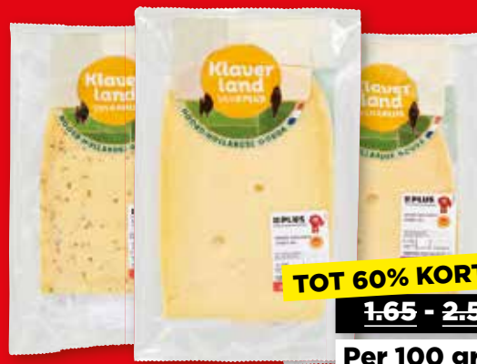
PLUS Klaverland Kaas 48+ plakken Alle varianten à ca. 180-350 gram

TOT 60% KORTING 1.65 - 2.56 Per 100 gram 1.65