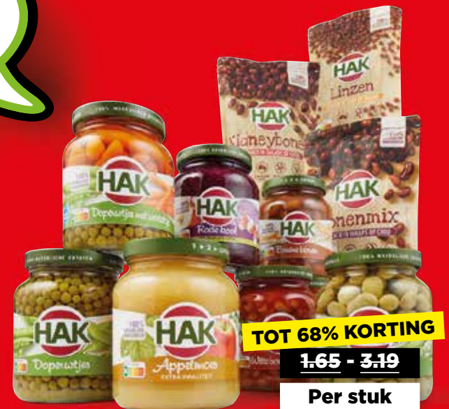
Hak Groenteconserven Alle potten à 330-370 gram of stazakken à 150-225 gram

TOT 68% KORTING 1.65 - 3.19 Per stuk 1.65