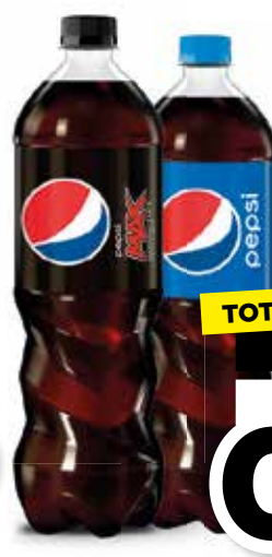
Pepsi Cola Max of regular, fles 1 liter