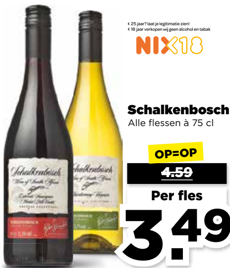
Schalkenbosch Alle flessen à 75 cl