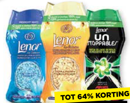
Alle Lenor Geurparels

TOT 64% KORTING 5.39 - 6.99 Per stuk 2.49