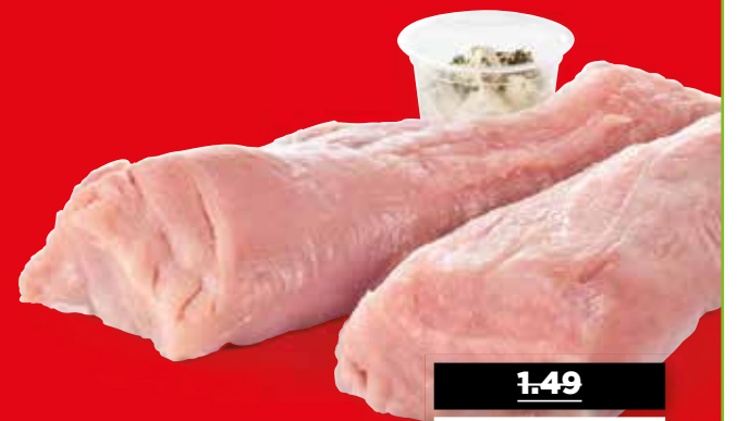
PLUS Varkenshaas lang

TOT 60% KORTING 1.65 - 2.56 Per 100 gram 1.65