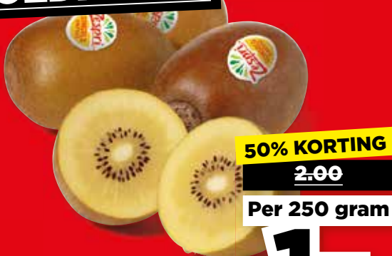
Zespri Kiwi gold Los