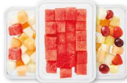
PLUS Vers gesneden fruit Meloenmix, watermeloen of luxe fruitsalade, bak 300 gram Uit de koeling