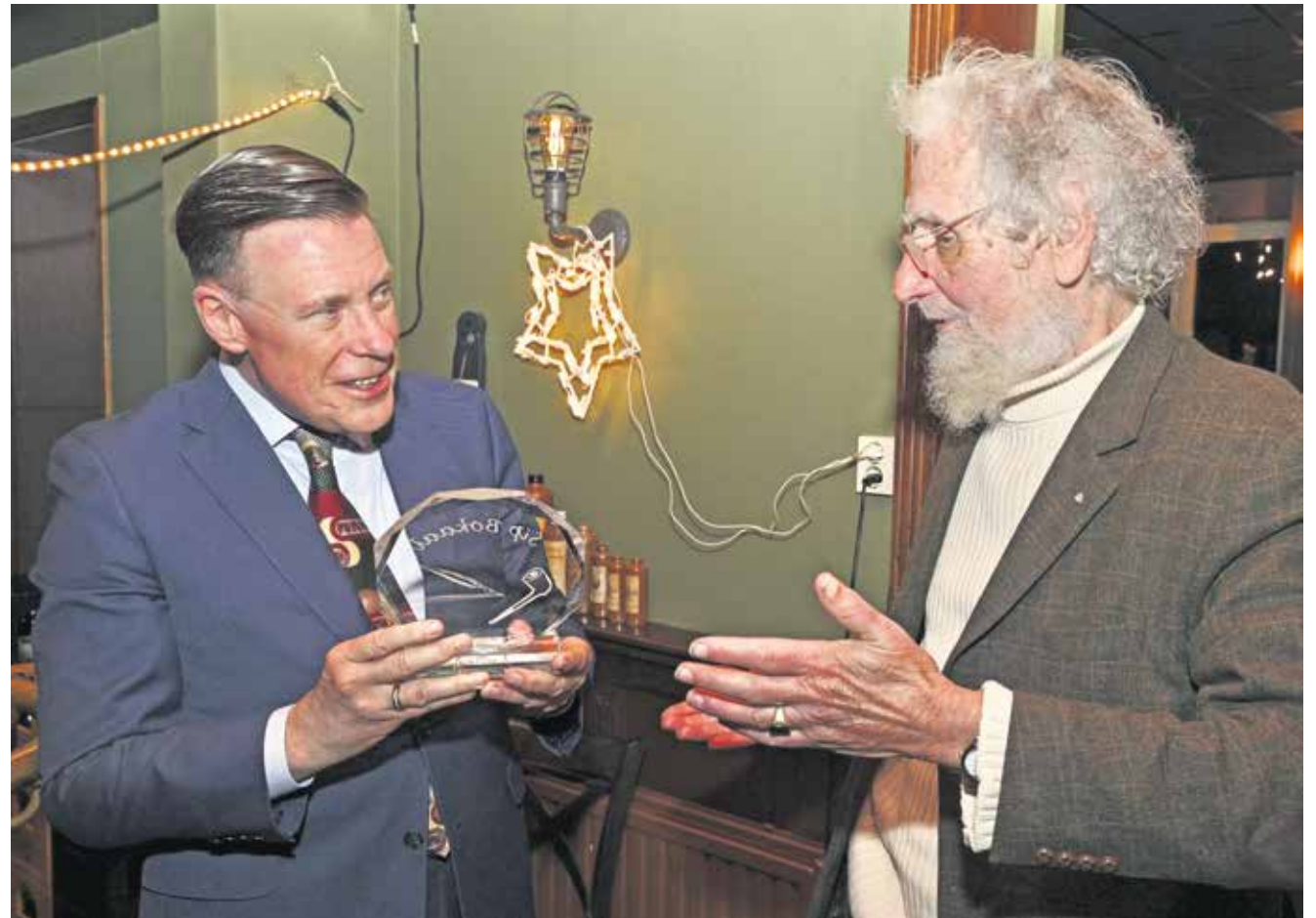
Uitreiking Sip Bokaal.

Op de tweede vrijdag in maart is tijdens de traditionele kerstbijeenkomst van de Herensocieteit v/h de Nuts Neut uit Olst voor de 14e keer de Sip Bokaal uitgereikt.