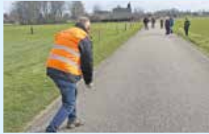
Maak kennis met klootschieten 8