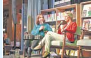
Oproep vrouwendag in Olst 12