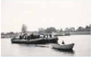
Lezing over de IJssel

Huis aan huis in de gemeente Olst-Wijhe, Dorpen Diepenveen, Windesheim, Liederholthuis en Broekland