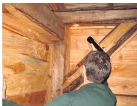
Een van de voorwaarden voor een goede bestrijding is een deskundige inspectie.