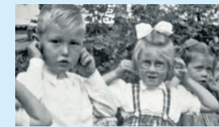
Afsluiting 'Olst door de jaren heen'