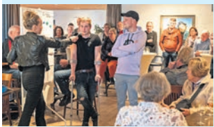
Welsum droomt verder

Huis aan huis in de gemeente Olst-Wijhe, Dorpen Diepenveen, Windesheim, Lierderholthuis en Broekland