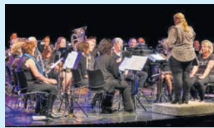
Wijhese Harmonie 140 jaar