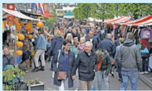
Inschrijving Koningsmarkt Wijhe