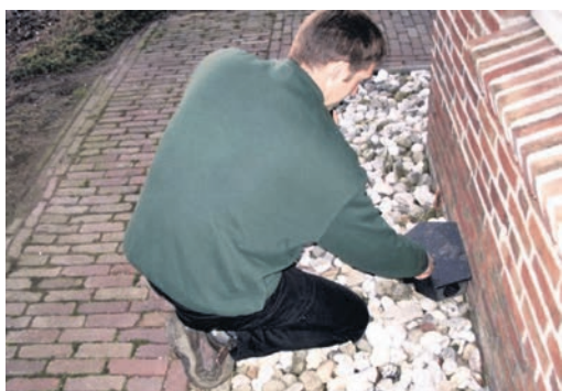
Regelmatig controleren van de lokaasdepots is belangrijk om de bestrijding goed te kunnen uitvoeren en in kaart te kunnen brengen.

De overheid wil met de nieuwe maatregel voorkomen dat we gif als preventie gebruiken. Maar als het echt uit de hand loopt, dan is Wagenaar een gecertificeerd bedrijf dat wel rodenticide mag inzetten. "Als ik er bij geroepen word, moet ik ook eerst op zoek naar de plekken waar ongedierte binnen kan komen, dan moet ik ze met vallen proberen weg te vangen. Pas als dat niet lukt, mag ik eventueel overstappen op gif. Bij een grotere rattenplaag, zoals op een boerderij, kan ik dan zelfs een buks inzetten om de dieren af te schieten. Daar ben ik als gerechtigde plaagdierenbestrijder speciaal voor gecertificeerd."