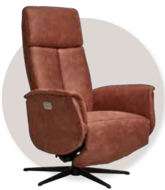
Handverstelbaar in stof leverbaar v.a. €845,-

Stressless® verloot onder iedereen die een proefzit maakt, een luxe wellness arrangement bij Thermae2000 in Valkenburg (2 dagen, 1 nacht voor 2 pers. in een 2 pers. kamer) t.w.v. €350,-. Bezoek onze Stressless® Studio, doe de proefzit en wellicht win jij wel!