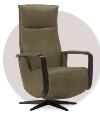
Handverstelbaar in stof leverbaar v.a. €1.550,-