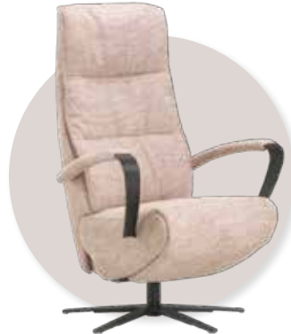
3-Motorig in stof leverbaar v.a. €2.778,-