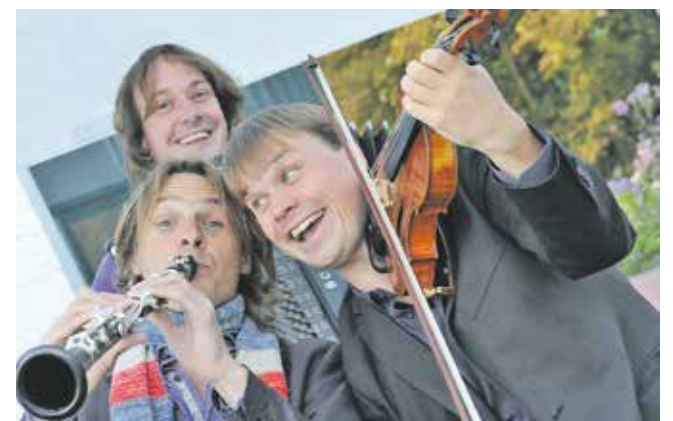
Trio C tot de Derde

Op zaterdag 18 maart a.s. nemen Wings en Trio C tot de Derde je mee op een Vlucht over de Wereldzeeën tijdens hun concert in het Holstohus. Tickets zijn verkrijgbaar via www.uthuus.nl of bij Eetkamer 'Hier is ut' in Olst.